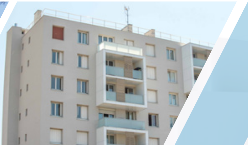
ESSONNE HABITAT Avenue de la Gare - Ris-Orangis Architecte Groupe A