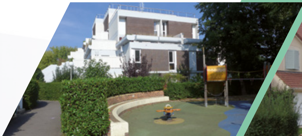
COOPEXIA Résidence Bel Air - Evry-Courcouronnes

COOPEXIA tire avantage de la transversalité du groupe, en ayant acquis une expérience toute particulière dans la gestion des rapports bailleur/locataire d'une part, et plus spécifiquement sur l'aspect social du recouvrement des charges comme des loyers.