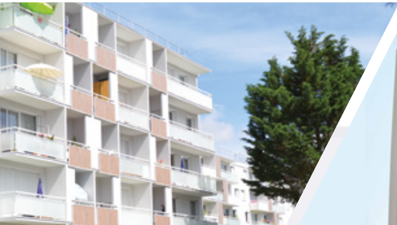
ESSONNE HABITAT Rue de l'Aunette - Ballancourt Architecte Lelli Architectes