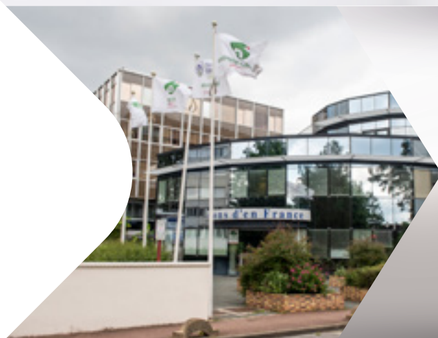
GROUPE ESSIA Siège du Groupe - Ris Orangis

Un Groupement d'Intérêt Économique (« GIE ») a été constitué entre les sociétés ESSONNE HABITAT, DOMENDI, TERRALIA, COPROCOOP et MC HABITAT .