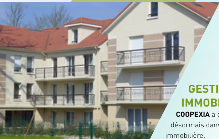
COOPEXIA Brétignères - Saint-Germain-lès-Corbeil