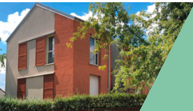
MC HABITAT Résidence Acacias - Chelles

Anticiper les besoins de logements dans les différents territoires est une démarche qui s'inscrit pleinement dans le travail mené par MC HABITAT . Que ce soit avec les communes au sein desquelles des résidences existent ou dans les futures villes où MC HABITAT développera son activité, une prise en considération des besoins des habitants, des spécificités architecturales et du cadre de vie aux abords des résidences est systématiquement observée. C'est ainsi que les projets engagés découlent d'un véritable partage d'intérêts et de valeurs, plaçant la qualité des résidences et le bien-être des locataires au cœur de la démarche de MC HABITAT .