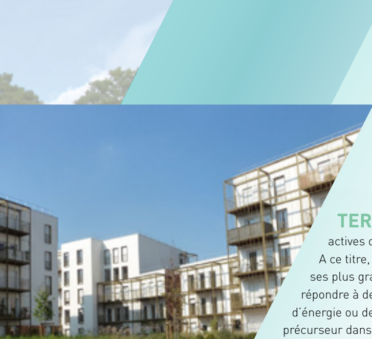
TERRALIA Docks de Ris-Orangis

TERRALIA est l'une des coopératives en accession les plus actives d'Ile-de-France.