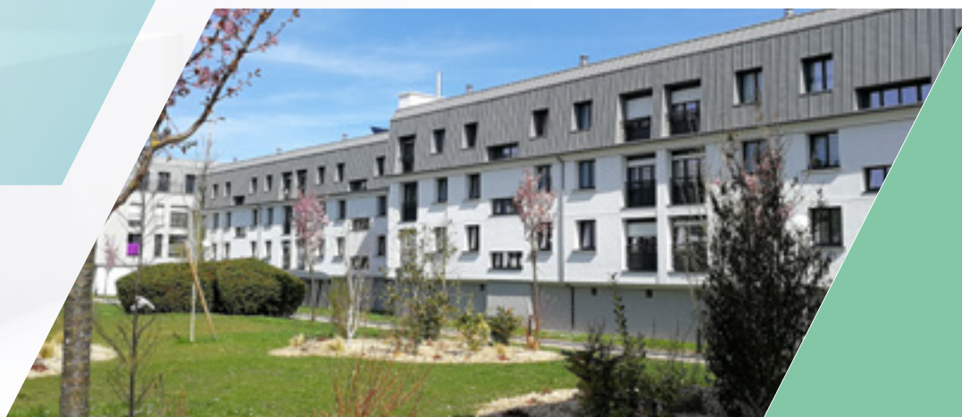
MC HABITAT Résidence Gay-Lussac - Chelles

Parce que les constructions les plus anciennes ne répondent plus à l'ensemble des besoins des locataires et aux objectifs fixés en matière de consommations énergétiques, des projets de rénovation ambitieux et innovants sont mis en place. Qu'ils soient passés, en cours ou à venir, ces projets sont systématiquement réalisés en concertation avec les habitants et en partenariat avec les communes concernées. L'objectif est d'améliorer l'habitat, de maintenir des loyers modérés grâce à la transition énergétique engagée et de réaliser des projets de qualité, dans le respect du maintien de notre équilibre financier. A ce jour, 800 logements ont été réhabilités sur les 5 dernières années.