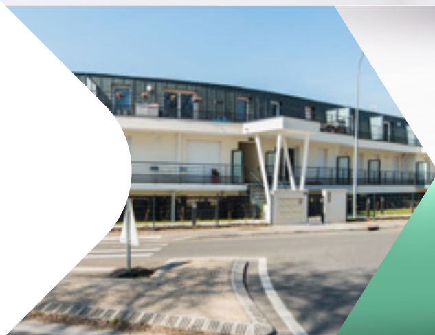
COOPEXIA Jardin de l'Orge - Sainte Geneviève des bois