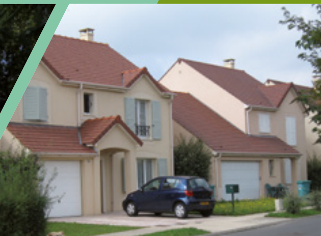
COOPEXIA Résidence Tournenfiles - Ormoy